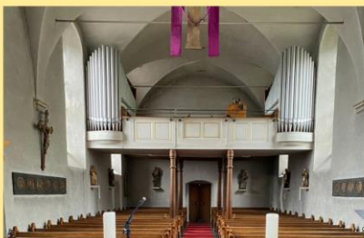
Oben: Sebald-Orgel von 1958 vor der Innenrenovierung der Kirche Unten: Visualisierung einer denkbaren Neugestaltung (© Orgelbau Fasen)

Bank: Sparkasse Mittelmosel Kontoinhaber: Kath. Kirchengemeinde St. Matthias Rechts und Links der Mosel, BIC MALADE51BKS, IBAN DE23 5875 1230 0000 0639 25 Verwendungszweck: “Orgel Kesten”